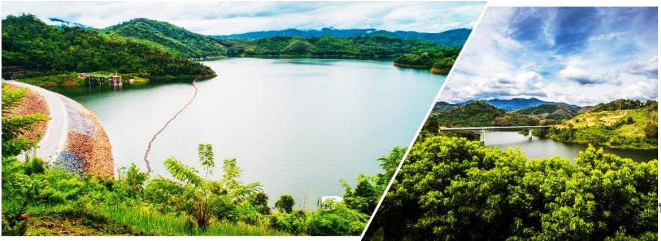
นหมอก ดอก

ประมาณ 268 เมตร และทำเป็นทางเดินตลอดสองข้างทาง ❖ ถ่ายรูปเป็นที่ระลึกบริเวณ ตู้ไปรษณีย์แห่งอำเภอเบตงที่มีขนาดใหญ่ที่สุดในประเทศไทยและใหญ่ที่สุดในโลก ตู้เดิมตั้งอยู่ที่บริเวณสี่แยกหอนาฬิกาใจกลางเมืองเบตง สร้างขึ้นเมื่อปี พ.ศ. 2467 ตั้งแต่ก่อนสมัยสงครามโลกครั้งที่สอง จุดประสงค์ที่สร้างไว้ในครั้งแรกก็เพื่อใช้เป็นที่กระจายข่าวสารบ้านเมืองให้ชาวเมืองเบตง ไกลกันเป็น หอนาฬิกาหมู่บ้านคูเมืองอำเภอเบตง ซึ่งเป็นสิ่งก่อสร้างเก่าแก่อยู่เคียงคู่กับเมืองเบตงมาช้านาน เปรียบเหมือนสัญลักษณ์ที่ตั้งอยู่จุดศูนย์กลางของเมือง สร้างด้วยหินอ่อนขาวนวลอันเลื่องชื่อจากยะลาที่ได้รับการยอมรับในเรื่องของความแข็งแรง สวยงามและคงทน อิสระให้ท่านกับภาพที่ระลึกตามอัธยาศัย ❖ สตรีทอาร์ตเบตง (Street Art Betong) แลนด์มาร์คใหม่กลางเมืองเบตงที่เล่าขานตำนานเบตงผ่านภาพวาด 11 จุดรอบเมือง เพื่อสร้างความประทับใจให้ชาวเบตงและนักท่องเที่ยวที่มาเยือน.